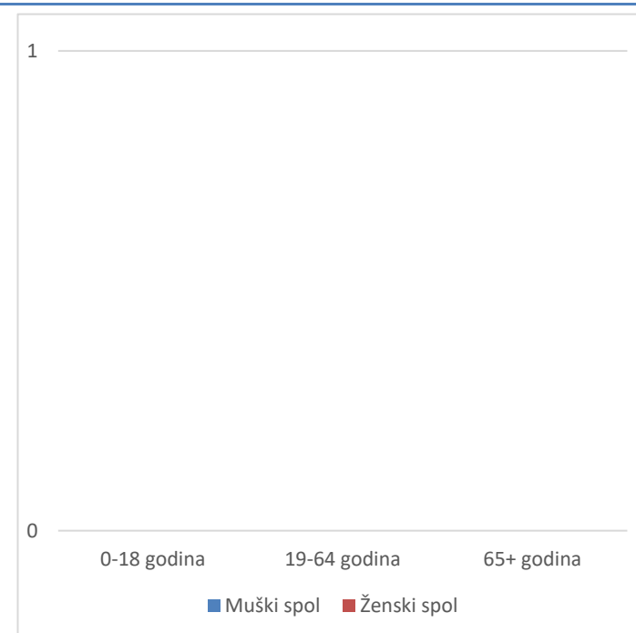
Grafikon 2. Spolna i dobna struktura preminulih u protekloj sedmici

Prosječna starost preminulih u protekloj sedmici je iznosila - godina