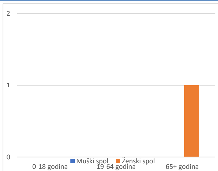
Grafikon 2. Spolna i dobna struktura preminulih u protekla 24 sata

Prosječna dob smrtnih ishoda je iznosila \pm godina