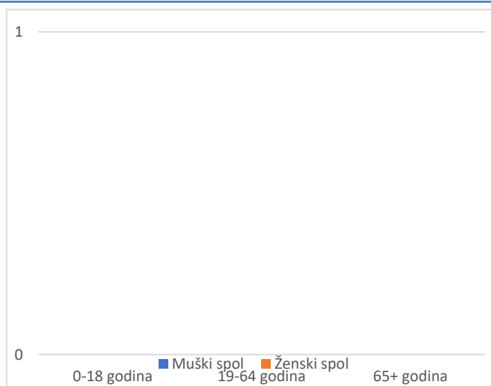
Grafikon 2. Spolna i dobna struktura preminulih u protekla 24 sata

Prosječna dob smrtnih ishoda je iznosila \pm godina