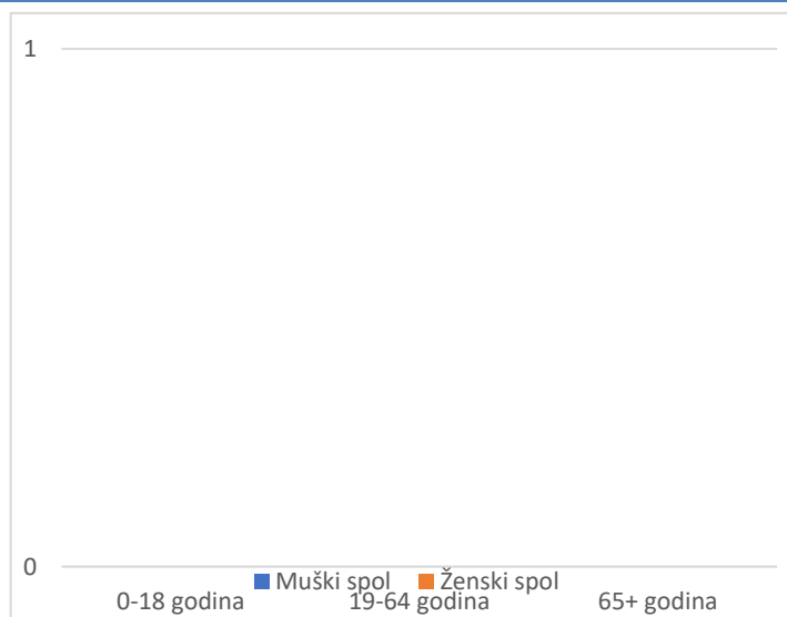
Grafikon 2. Spolna i dobna struktura preminulih u protekla 24 sata

Prosječna dob smrtnih ishoda je iznosila \pm godina