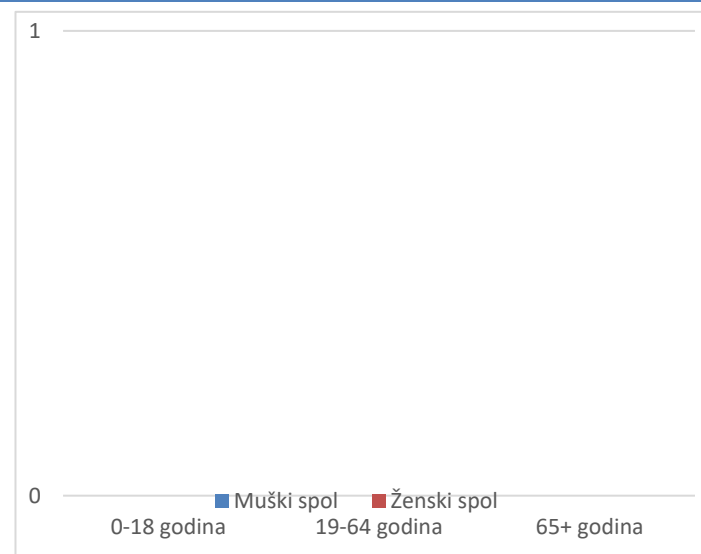
Grafikon 2. Spolna i dobna struktura preminulih u protekla 24 sata

Prosječna dob smrtnih ishoda je iznosila \pm godina