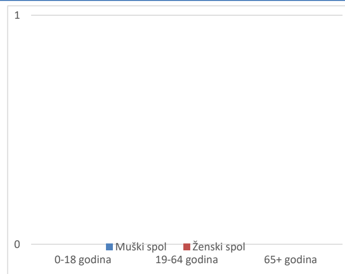
Grafikon 2. Spolna i dobna struktura preminulih u protekla 24 sata

Prosječna dob smrtnih ishoda je iznosila \pm godina