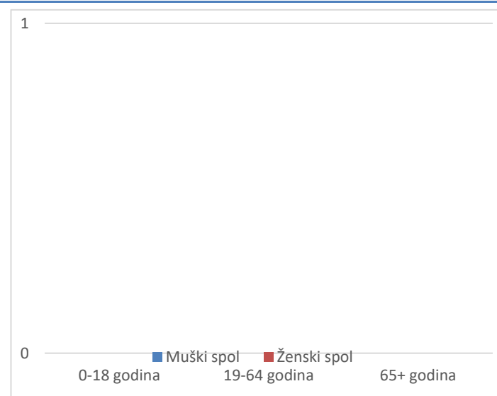
Grafikon 2. Spolna i dobna struktura preminulih u protekla 24 sata

Prosječna dob smrtnih ishoda je iznosila \pm godina