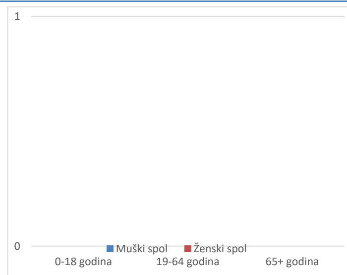
Grafikon 2. Spolna i dobna struktura preminulih u protekla 24 sata

Prosječna dob smrtnih ishoda je iznosila \pm godina