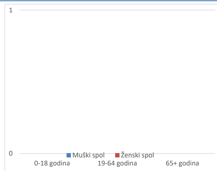
Grafikon 2. Spolna i dobna struktura preminulih u protekla 24 sata

Prosječna dob smrtnih ishoda je iznosila \pm godina