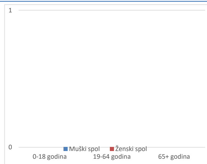
Grafikon 2. Spolna i dobna struktura preminulih u protekla 24 sata

Prosječna dob smrtnih ishoda je iznosila \pm godina