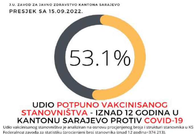
Infografika 2. Udio potpuno vakcinisanog stanovništva iznad 12 godina u Kantonu Sarajevo