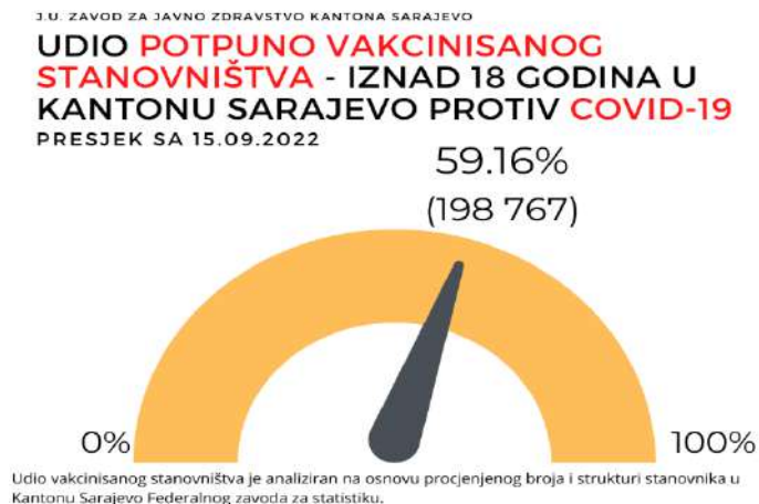
Infografika 1. Udio potpuno vakcinisanog stanovništva iznad 18 godina u Kantonu Sarajevo

Na osnovu zbirnih podataka iz informacionog sistema Zavoda zdravstvenog osiguranja Kantona Sarajevo (koje sadrže i podatke o vakcinisanim osobama van ustanova Kantona Sarajevo) i analize J.U. Zavod za javno zdravstvo Kantona Sarajevo, na Infografici 1. predstavljen je udio potpuno vakcinisanog stanovništva Kantona Sarajevo, starijeg od 18 godina. Na tabeli 1 predstavljena je starosna struktura potpuno vakcinisanih osoba.