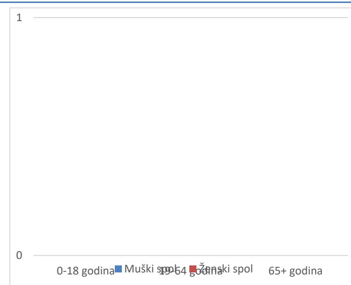
Grafikon 2. Spolna i dobna struktura preminulih u protekla 24 sata

Prosječna dob smrtnih ishoda je iznosila \pm godina