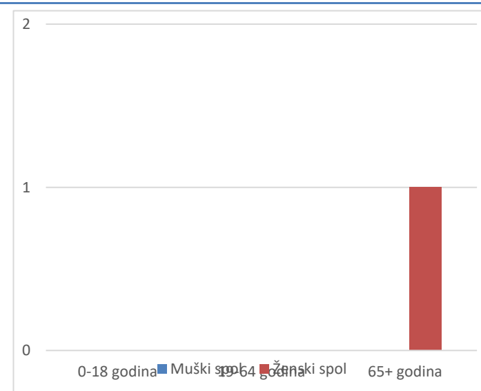
Grafikon 2. Spolna i dobna struktura preminulih u protekla 24 sata

Prosječna dob smrtnih ishoda je iznosila \pm godina