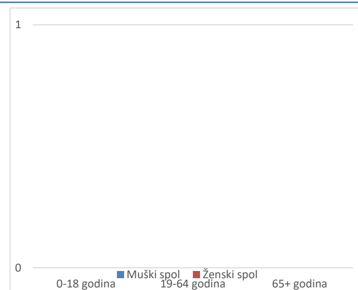
Grafikon 2. Spolna i dobna struktura preminulih u protekla 24 sata

Prosječna dob smrtnih ishoda je iznosila \pm godina