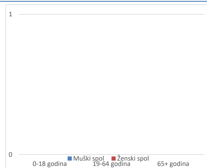
Grafikon 2. Spolna i dobna struktura preminulih u protekla 24 sata

Prosječna dob smrtnih ishoda je iznosila \pm godina