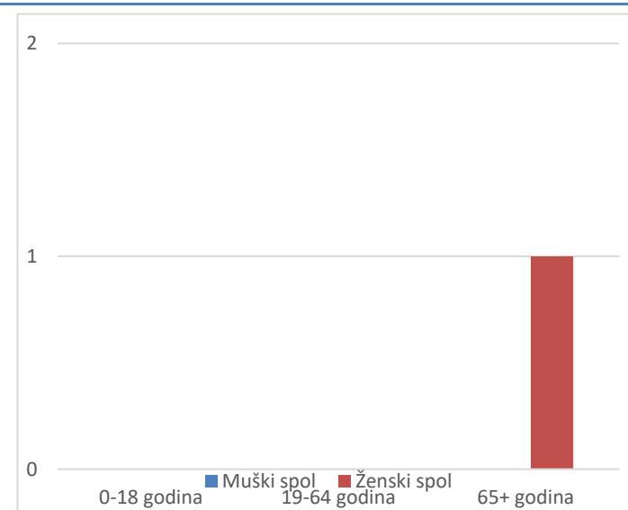
Grafikon 2. Spolna i dobna struktura preminulih u protekla 24 sata

Prosječna dob smrtnih ishoda je iznosila \pm godina