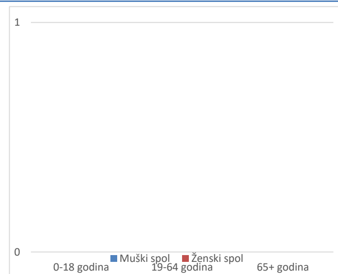
Grafikon 2. Spolna i dobna struktura preminulih u protekla 24 sata

Prosječna dob smrtnih ishoda je iznosila \pm godina